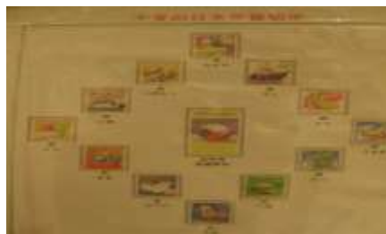
2月12日～2月26日 切手アート東海作品展・トピカル切手展 切手アート東海