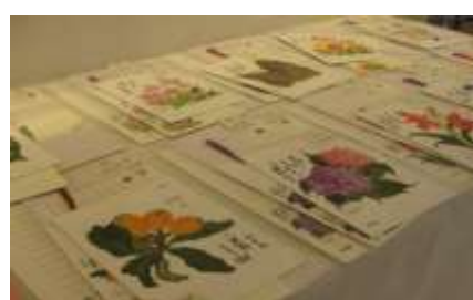
4月16日～5月6日 春の花 作品展 武下久美子