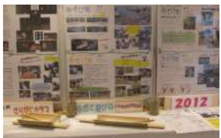
4月1日～4月14日 THE あそび虫展 学童保育ざりがにクラブ