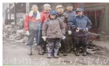
3月15日～3月17日 釜石市「復興の狼煙」ポスター展 東海市企画政策課