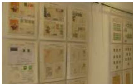
6月18日～7月2日 切手コレクション展 東海郵趣会