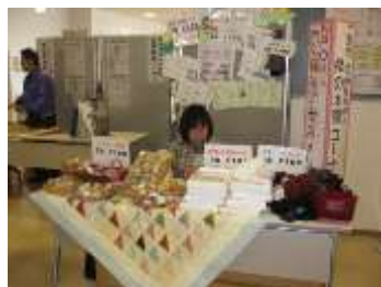
あいち福祉アセスメント