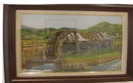
5月7日～5月30日 加木屋教室 作品展 ちぎり絵白美