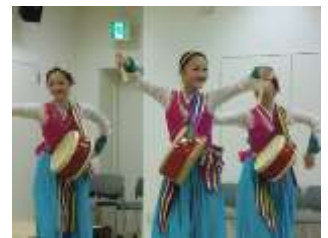
コリアンネットあいち

小会議室では平成おはなしおじさん、大会議室では、ダンス・演劇・小学生による御殿万歳・民族舞踊など、華やかな舞台発表がありました。