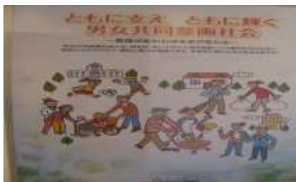
2月19日～3月4日 男女共同参画啓発パネル展 まち・ネット・みんなの広場