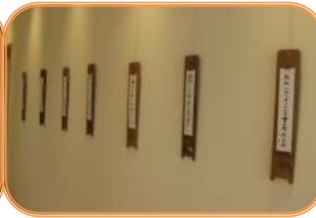
とうかい柳壇川柳会 7月2日(水)～7月16日(水)