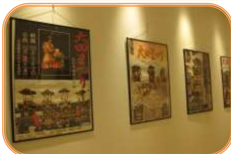
NPO 法人まち・ネット・みんなの広場 9月30日(火)～10月7日(火)