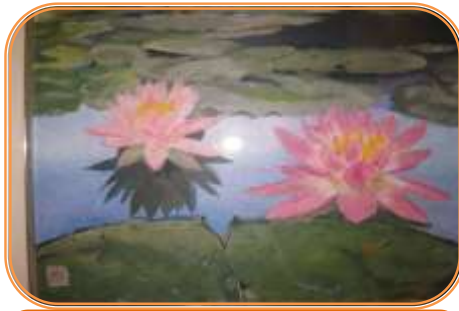
ちぎり絵白美 6月17日(火)～7月1日(火)