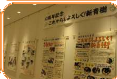
特定非営利活動法人新青樹 10月8日(水)～10月21日(火)