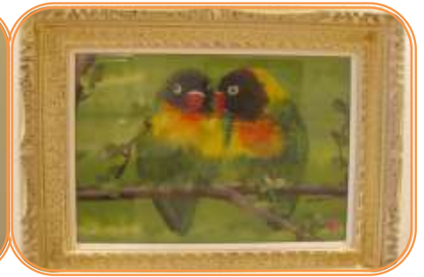
ちぎり絵白美 7月18日(金)～8月1日(金)