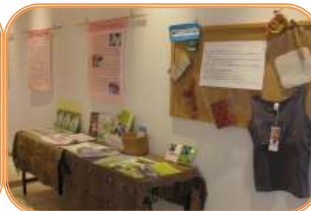
フェアトレードの会 8月18日(月)～8月31日(日)