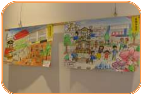
大田コミュニティ 8月11日(月)～8月17日(日)