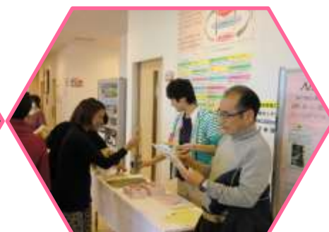
ファンドレイジング