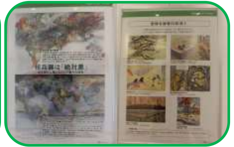
戦後70周年記念行事パネル展