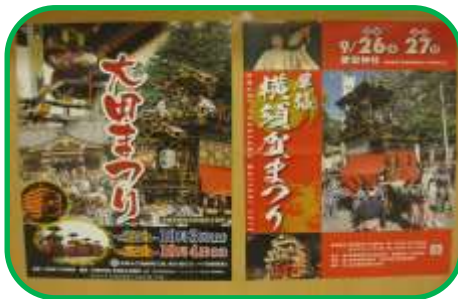
東海市の2大からくり山車まつり 過去のポスター展