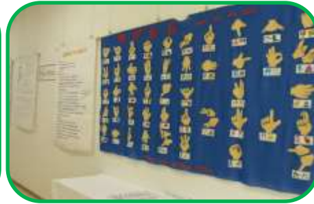
手話サークルふれあいD展