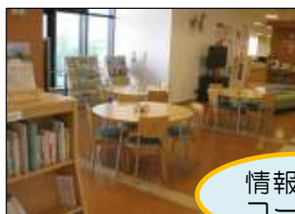
情報交流 コーナー