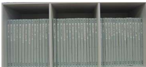
登録団体ファイル

を作成しました。登録団体ファイルは主な活動内容が分かるだけでなく、現在行っている活動やこれからの活動もファイルしていただくと団体からの情報発信として活用できるかと思えます。皆様の活動に役立てていただければ幸いです。